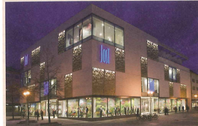
Nachtaufnahme Modehaus Jost in Bruchsal. (Foto: Blocher Blocher Partners, Stuttgart)

Überall, wo technisch funktionelles, zeitloses Design und Transparenz gefragt sind, haben in den letzten Jahren Loch- und Prägebleche einen nahezu triumphalen Einzug gehalten, der noch längst nicht zu Ende ist - egal, ob in der Außen wie auch in der Innenarchitektur. Die Einsatzmöglichkeiten sind vielseitig, wie zum Beispiel beim neueröffneten Modehaus Jost in Bruchsal, das von den Architekten Blocher Blocher Partners aus Stuttgart gestaltet wurde.