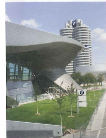
"BMW-Welt in München: Moderne Anmutung durch Lochblechfassade"

Zu Panelen zusammengesetzt, werden die profilierten Bleche entweder auf der Gebäudewand angebracht oder statt derer montiert. Für letzteres kommen Treppenhäuser zum Beispiel von Parkhäusern, öffentliche Gebäude wie Bahnhöfe oder generell Objektbereiche in Frage, die „luftig“ umschlossen werden sollen. Das Baumaterial bietet ein enormes Einsatzpotenzial.