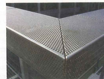
"Lochblech im Detail: Breites Brüstungsgeländer"

tieren, um den Aufwand am Gebäude zu reduzieren. Für besonders hohe Güteanforderungen sollten die Elemente von Herstellern bezogen werden, die nach dem RAL-Gütezeichen Lochbleche zertifiziert sind. Dem Design sind kaum Grenzen gesetzt, zumal sich das Ausgangsmaterial werkseitig individuell formen und perforieren lässt. Bei Beschädigungen oder Erweiterungen werden die betroffenen Panels einfach ausgetauscht. Ihre Langlebigkeit ist hinreichend bewiesen: Lochblechprofile finden sich sogar als Bodenbelag auf öffentlichen Plätzen. Für