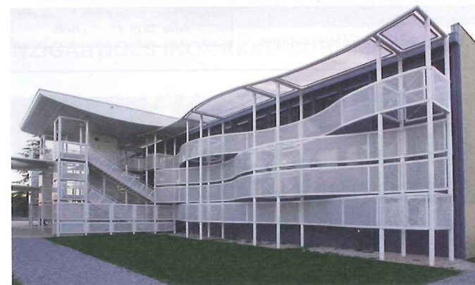
"Wenig Aufwand, viel Wirkung: Lochblechpaneele lockern triste Fassaden auf."

Sowohl weiche Konturen als auch harte Kanten, helle und dunkle Kontraste, sowie ruhige und bewegte Flächen fügen sich bei dieser außergewöhnlichen Fassade zu einem perforierten Bild zusammen, das in seiner Wirkung bei Tag und bei Nacht (hinterleuchtet) verblüfft. Die Größe der Bilder ist nahezu unbegrenzt - durch eine Unterteilung in Einzelbleche können auch komplette Fassaden realisiert werden. Hier wurden außergewöhnlich große Blechformate von bis zu 4.200 mm x 2.294 mm bei einer Blechstärke von 4 mm realisiert. Die Firma Moradelli GmbH in Kirchheim bei München fertigt Loch- und Prägebleche - auch in Kleinserien - speziell nach Kundenzeichnungen und in gewünschten Zuschnitten. Die Möglichkeiten Loch- und Prägebleche mit anderen Materialien zu kombinieren, eröffnen für den Anwender viele ungeahnte Möglichkeiten. info@moradelli.de , www.moradelli.de