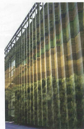
"Naturmotiv als Fototextur auf Lochblech"

oder mit starkem Akzentlicht versehen werden. So werden auch Blendungen eliminiert. Das geringere Ausbleichen der Farben von Innenraum-Materialien ist ein willkommener Nebeneffekt. Unzählige Gestaltungsansätze ergeben sich allein durch die Variation der Größe von Panel, Lochdurchmesser und Lochabstand.