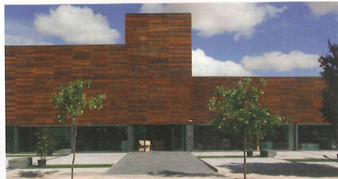
"Fassaden aus unbehandeltem Lochblech entwickeln einen besonderen Charme durch die gewollte Korrosion"

Auch bei widrigen Wetterbedingungen bieten Lochbleche effektiven Schutz. Sie zerstreuen starke Winde, um den Druck vom Gebäude zu nehmen und den Geräuschpegel draußen wie drinnen erheblich zu reduzieren. Bei Starkregen werden die dahinter befindlichen Fensterflächen weitgehend geschont - selbst ein